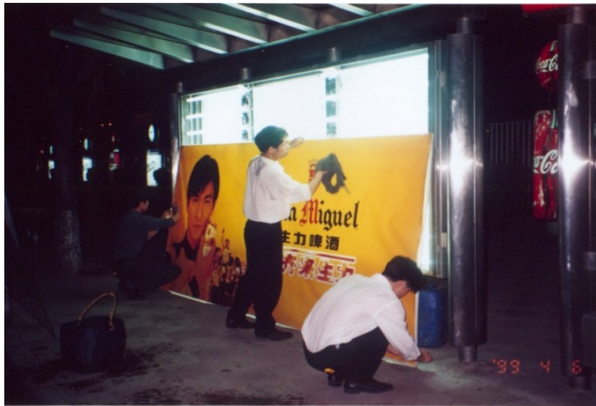
运维人员进行广告画面维护，保证画面始终处于最美观效果